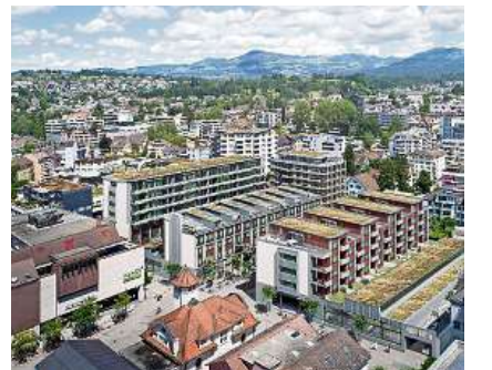
Rechts vom Manor: Das Citycenter.